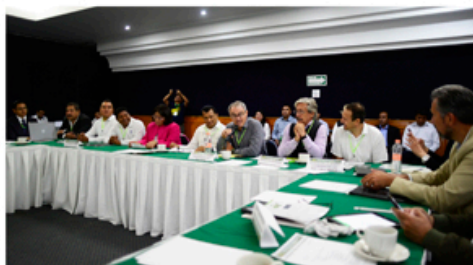
Reunión de Planeación GCF Task Force México

Con la participación de los y las delegadas de los siete estados miembros de la red de trabajo del GCF Task Force México, la Coordinación Regional, socios implementadores, representación del Secretariado del GCF, autoridades del Gobierno del Estado de Oaxaca y una amplia lista de invitados especialistas en políticas ambientales, de cambio climático, pueblos indígenas, comunidades locales, iniciativa privada y de desarrollo rural, se llevó a cabo la Reunión Regional del GCF Task Force México el pasado 1 y 2 de Agosto de este año 2019.