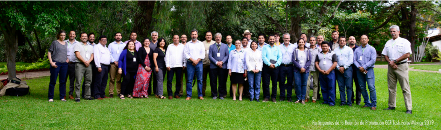
Participantes de la Reunión de Planeación GCF Task Force México 2019