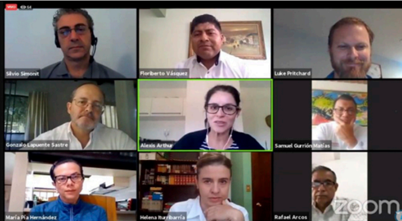
Clausura del proyecto Plan de Inversión para DRBE Oaxaca.